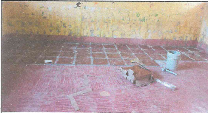
Foto1: SUSTITUCION DE PISO CERAMICO